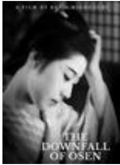
1935 : La cigogne en papier