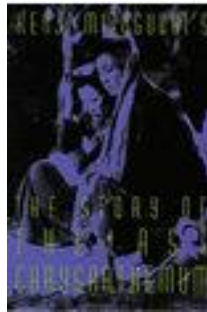
1939 : Conte des chrysanthèmes tardifs