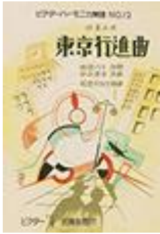
1929 : la marche de Tokyo