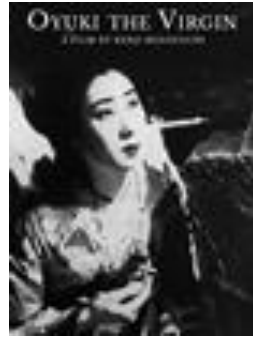
1935 : Oyuki, la vierge