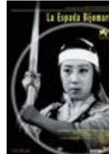
1945 : L'excellent épé Bijorima