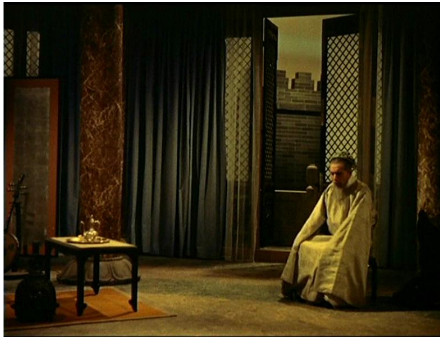
Kenji Mizoguchi(1898-1956) : 89 films dont 40 conservés Date de reconnaissance internationale : 1953