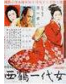
1936 : Les sœurs de Gion