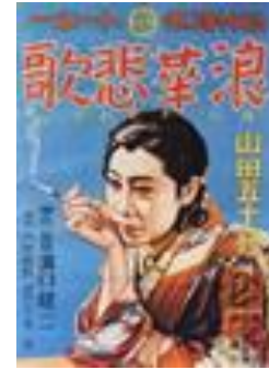
1936: L'élégie de Naniwa