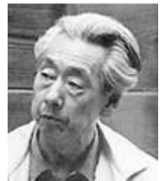
Mikio Naruse (1905-1969) 1993