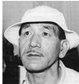
Yasujiro Ozu (1903-1963) 1978