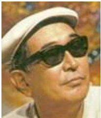
Akira Kurosawa (1910-1998) 1951