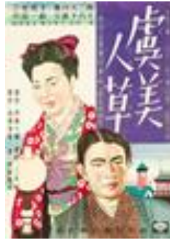
1935 : Les coquelicots